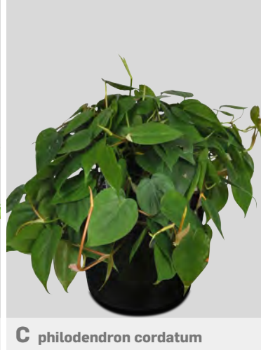
C philodendron cordatum