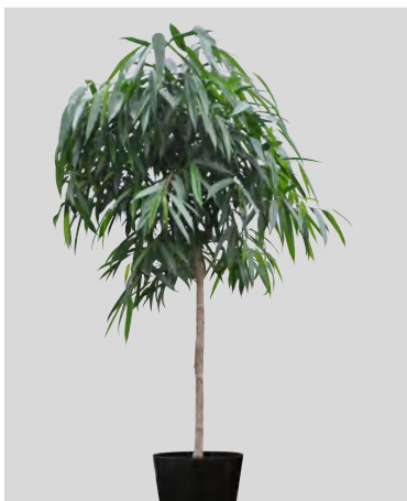
V ficus alii