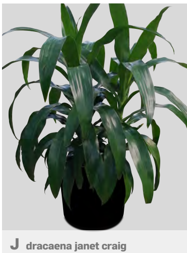
J dracaena janet craig