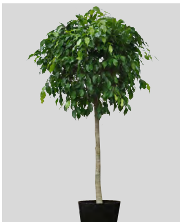
W ficus benjamina