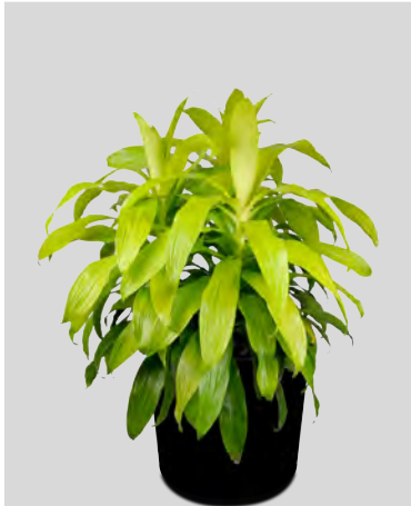
N janet craig lime light