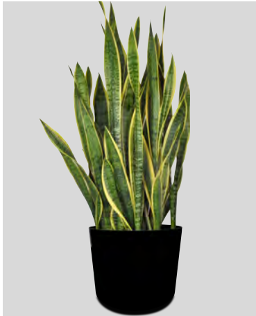
O sansevieria laurentii