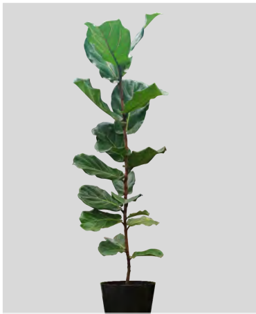
R ficus lyrata