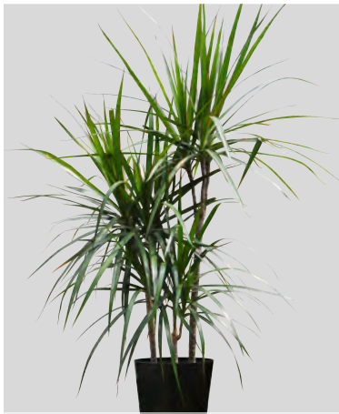
Q dracaena marginata