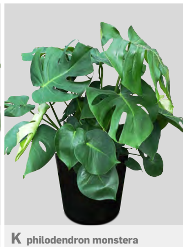
K philodendron monstera