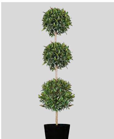
U eugenia topiaire 3 boules