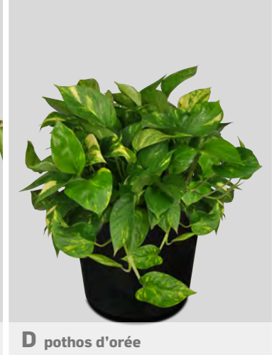
D pothos d'orée